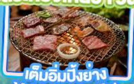
เค็มอิมบิงย่าง Yakiniku Buffet