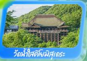
วัดน้ำใสคิโยมิสุเดระ