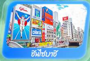
ชินไซบาชิ