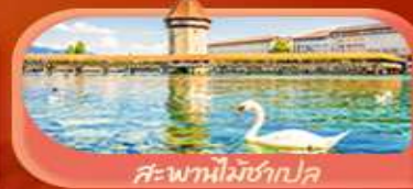
สะพานไมซ์ฮอป