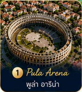
1 Pula Arena ปูลา อารีนา