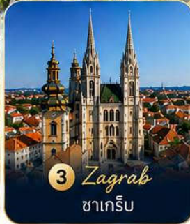
3 Zagreb ซาเกร็บ