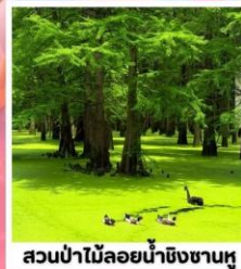
สวนป่าไม้ลอยน้ำชิงชานหู