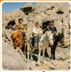
ชาวมองโกล