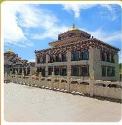
ทำเนียบพระลามะอูหลาน

• ไอโอรท์ เป็นทราเวลเอเจนซี่ชาวจีน แหล่งท่องเที่ยวระดับ 5A ของจีน แกรนด์แคนยอนแม่น้ำเหลือง ซูอูฐท่ามกลางทะเลทราย