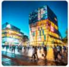
ย่านชานหลี่ถุน