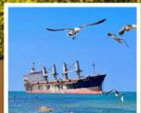
เรือสินค้าเกย์ตันบลูอิส