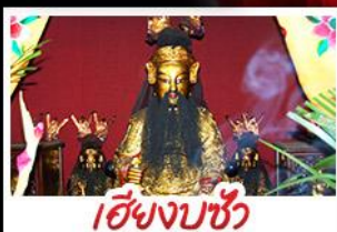
เอียงบูซิว