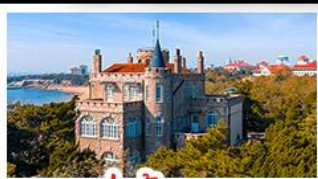
ป่าตึกวน

พระราชวังฤดูร้อน - วิวเมืองซิงเต่า รถไฟความเร็วสูง - ภูเขาเหลาซาน กำแพงเมืองจีนด่านจวิยงกวน - ป่าตึกวน พักโรงแรมระดับ 4 ดาว - ไม่ลงร้านช้อปปิ้งพิเศษ เปิดปักกิ่ง , หม้อไฟซีฟู้ด