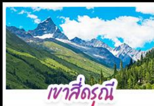
เขาสี่ดรุณี