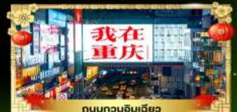
ถนนทวงฉิมเฉียว