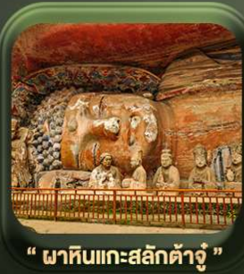
“ พาทินแเกาะสลักต้าจู้ ”