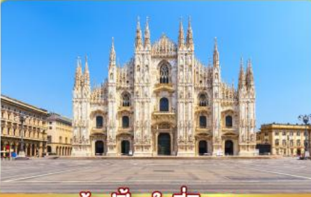
ซอปบิงจู่ที่มิลาน