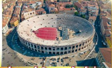
โรงละครโรมันกลางจัวงเวโรน่า