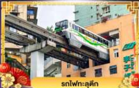
รถไฟฟ้า-ลูตัก