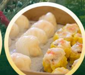
ตีบซ่าฮ่องกง