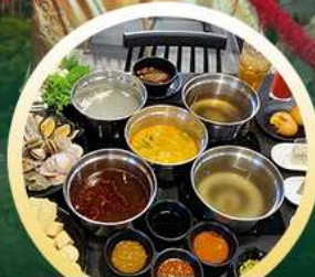
ซาบู่ฮ่องกง

02-04 มิ.ย. 18-20 มิ.ย. 07-09 มิ.ย. 20-22 มิ.ย. 13-15 มิ.ย. 25-27 มิ.ย. 14-16 มิ.ย. 28-30 มิ.ย.