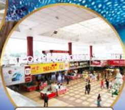
ตลาดกึ่งเปีย