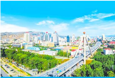
เมืองซีเหมิน