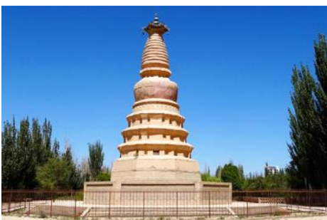
เจดีย์ม้าขาว

เที่ยง รับประทานอาหารกลางวัน ณ ภัตตาคาร (10)