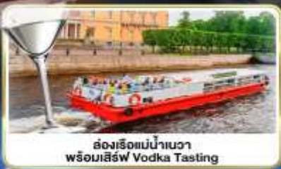
ล่องเรือแม่น้ำเนวา พร้อมเสิร์ฟ Vodka Tasting

เดินทาง : 14-21 มิ.ย.69 / 28 มิ.ย.-05 ก.ค.69 / 24-31 ก.ค.69