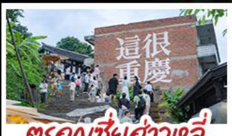
ตรอกเซี่ยฮ่าวหลี่