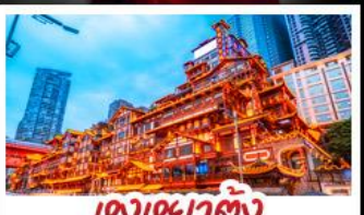
แดงเฉาตัง