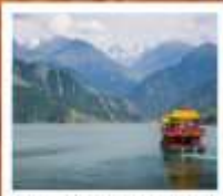
ห้องเรือทะเลสาบเทียนฉือ