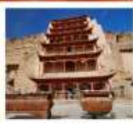
ถ้ำม่อเกาถู