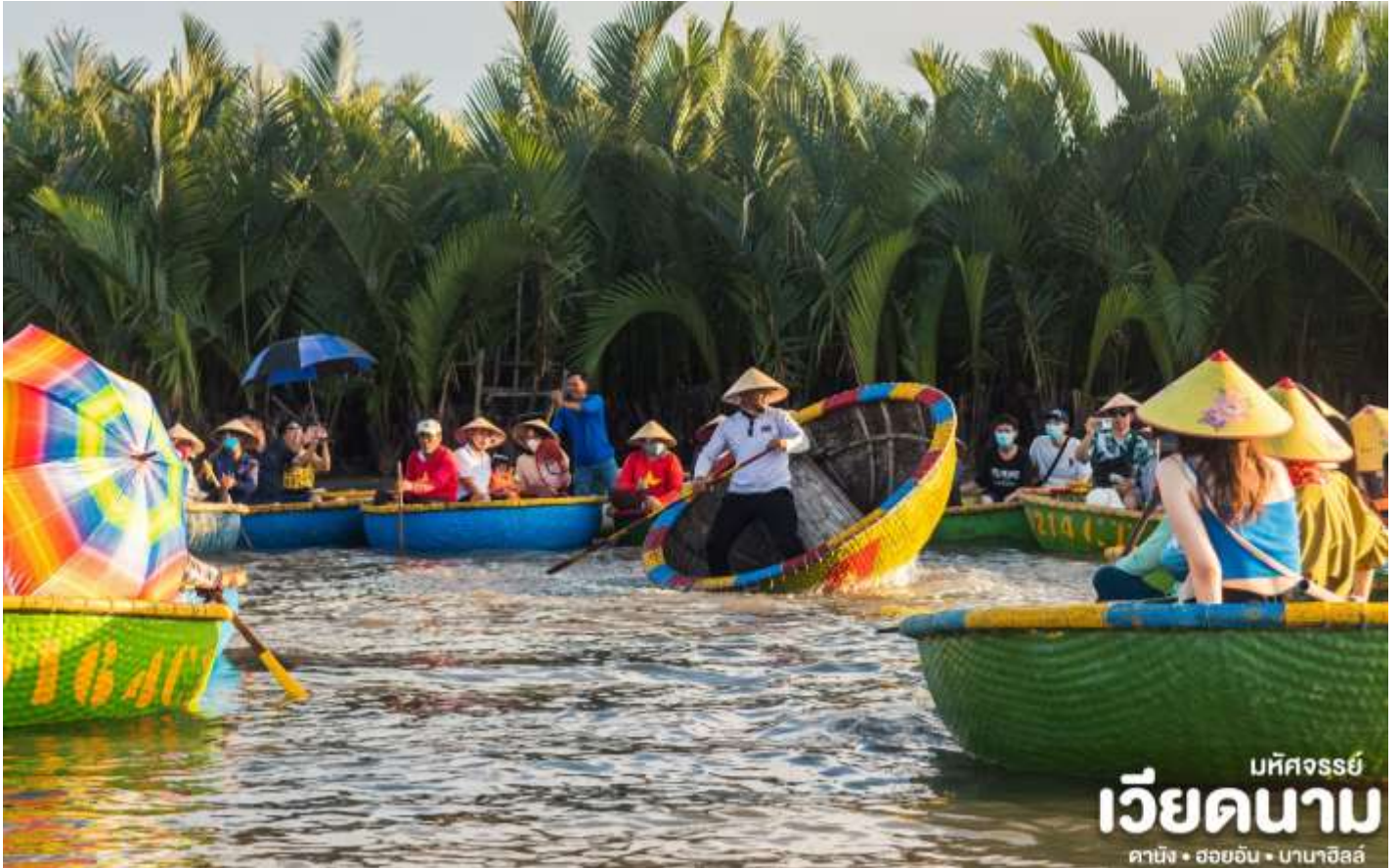
บทวิจารณ์ เวียดนาม ดาบิง • ฮอยอัน • บานาฮิลล์