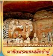
พาสันพระแกะสลักต้าจู๊