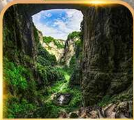
อุทยานหลุมฟ้า 3 สะพานสวรรค์