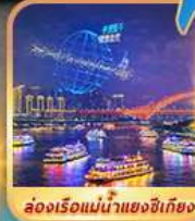
ล่องเรือแม่น้ำแยงซีเกียง