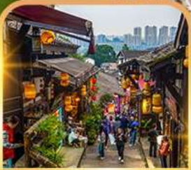
หมู่บ้านโบราณฉือชี่โจว