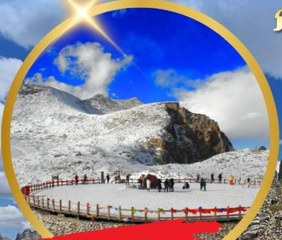
OPTIONAL TOUR ธารน้ำแข็งต่ากู่ปิงชวณ