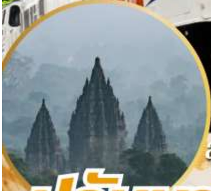
มรดกยูเนสโก ทาวสถานอินดู สุดยิ่งใหญ่