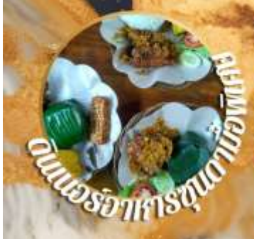
อาหารจานเดียวที่อร่อยที่สุด