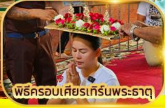
พิธีครอบเศียรเทีร์นพระธาตุ