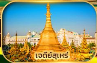
เจดีย์สุเหร่า