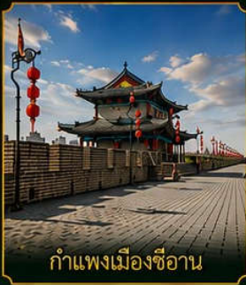
กำแพงเมืองซีอาน