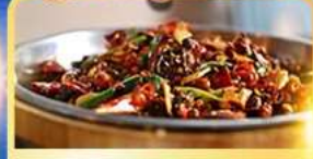
อาหารเสฉวน