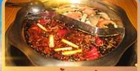
สุกี้ท้องถิ่น