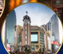
ถนนคนเดินเจียงฟางเป่ย์