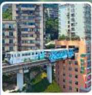
รถไฟฟ้า-อูตัก