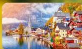
การันตีที่พัก Hallstatt / St. Wolfgang หรือริททะเลสาบ 1 คืน