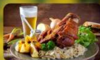
พิเศษ! ลิ้มลองเมนูประจำชาติ ทั้ง 5 ประเทศ!!!