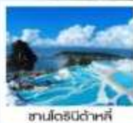
ซานโตริณีต้าหลี่