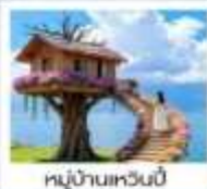
หมู่บ้านเหวินปี้