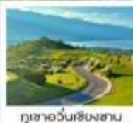
ภูเขาวันเชียงซาน