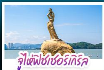
จุ๊เซ่ฟิซซอร์เทิร์ล