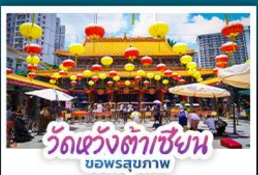
วัดแห่งต้าเซียงน บอพรสุบภาพ