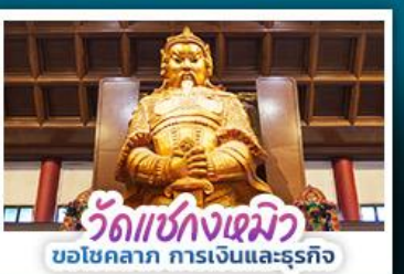
วัดแซ่กงเฉมวี่ ขอโชคกลาง การเงินและธุรกิจ