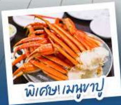
พิเศษ! เมฆหุซุ