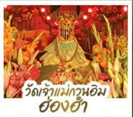
วัดเจ้าแม่กวนอิมอ่องฮ่า