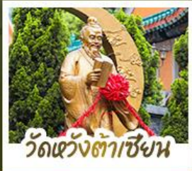
วัดเว้งต้าเซ้าเซ็ง