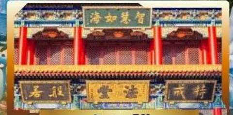
วัดจีนไท่