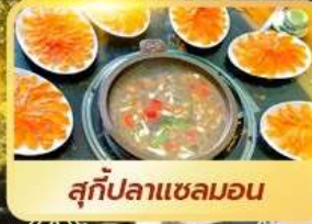
สุกี้ปลาแซลมอน