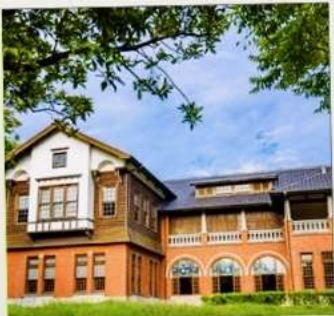
พิพิธภัณฑน์น้ำพุร้อนเป่ย์โถว