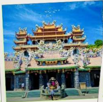
วัดกวนตู่