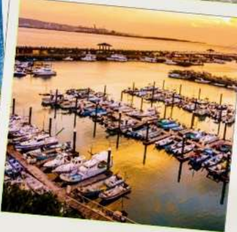
ท่าเรือประมงตั้นส่วย