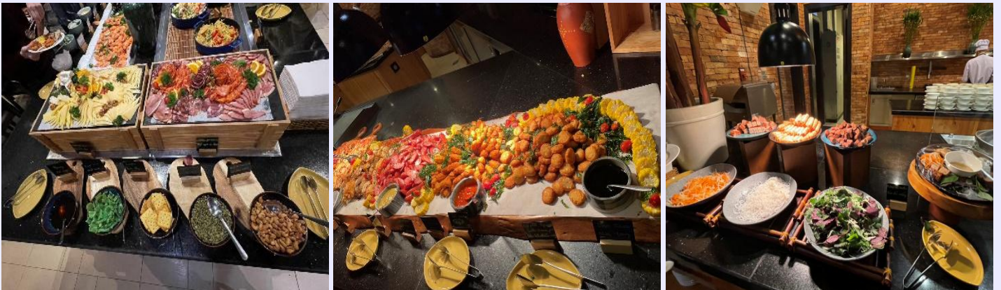
ที่พัก MERCURE DANANG FRENCH VILLAGE BANA HILLS HOTEL หรือเทียบเท่า ระดับ 4 ดาว

หมายเหตุ กรณีลูกค้าเดินทาง 3 ท่าน ห้องพักบนบานาฮิลล์ เป็นห้องแบบ FAMILY BUNK (เตียง 2 ชั้น 2 เตียง) โดยมีค่าใช้จ่ายเพิ่ม 1,500 บาท/ห้อง/คืน *** เนื่องจากห้องพักบนบานาฮิลล์ ไม่มีห้องพักบริการสำหรับ 3 ท่าน *** **สำหรับคืนที่พักบนบานาฮิลล์ โปรแกรมและคืนเข้าพัก อาจมีการปรับเปลี่ยนได้ ทั้งนี้ขึ้นอยู่กับการจัดการของโรงแรม ทางบริษัทสามารถสลับปรับเปลี่ยนได้ตามความเหมาะสม โดยไม่ต้องแจ้งให้ทราบล่วงหน้า**