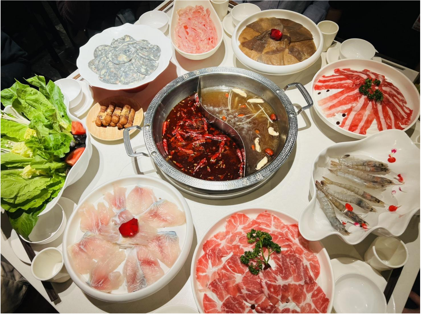
คำ รับประทานอาหารคำ ณ ภัตตาคาร (เมื่อที่ 9) *เมนูพิเศษ สุกีหมาล่าเสฉวน