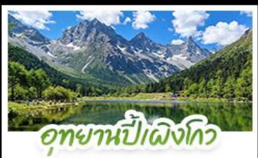
อุทยานป่าฝิ่งโกว

อุทยานสีดรุณี • อุทยานป่าฝิ่งโกว • เมืองตู่เจียงเยียน รูปปั้นหมีแพนด้าอนเซลฟี่ • ร้านหนังสือจงซูเก๋อ • วัดต้าอิว ถนนโบราณชอยกว้างชอยแคบ • ถนนคนเดินซุนซีลู่ • ถนนไท่กู่หลี่ หมีแพนด้าปับติก IFS • ชมแสงสีน้ำพุไม้ไฟติก SKP • ชมตึกแฝดเจิงตู