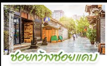
ชอยกว้างชอยแคบ