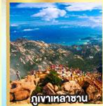
กุเขาเหลาซาน