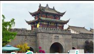
เมืองโบราณทวนเซี่ยน

ภูเขาสี่ดรุณี - อุทยานบ่ิฝิ่งโกว - สะพานหนานเฉียว - ร้านหนังสือจงซูเก้อ - เมืองโบราณกวนเสียน จตุรัสหยางเทียนหู่ - พิพิธภัณฑ์ชาฟี่ - ถนนโบราณชอยกว้างชอยแคบ - ถนนคนเดินไถ่กู๋หลี่ ถนนคนเดินซุนซี - ถนนโบราณจั้นหลี่ - พิพิธภัณฑ์เปิ่นตีก - บ้านฟู่ไม้อีตีกSKP - วัดต้าฉือ