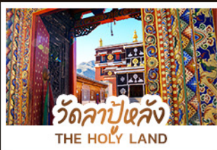
วัดลาปูหลง THE HOLY LAND

หนึ่งศรัทธา: สัมผัสความสงบและสถาปัตยกรรมทิเบตที่ วัดลาปูหลง หนึ่งผืนหญ้า: ส่องลอยไปในความเขียวจีของ ทุ่งหญ้าชางเคอ หนึ่งสายน้ำ: ค้นพบความงามเหนือกาลเวลาที่ จิวจ้ายโกว