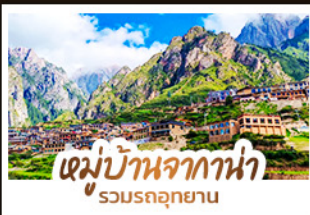
หมู่บ้านจากาน่า รวมรถอุทยาน