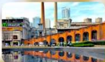
ตงเจียวจื่ออี้