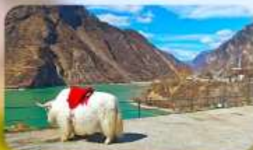
กะเลสาบเค่อซี