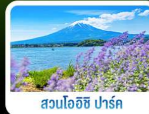
สวนโออิชิ ฟูจิ