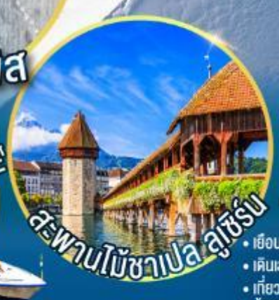
สะพานไม้อาเป ลูเซิร์น