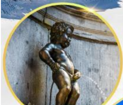
มานกันพิส