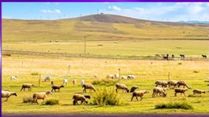
ทุ่งหญ้าชิลามูเหมิน