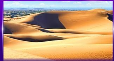
ทะเลทรายอินเคินทาลา