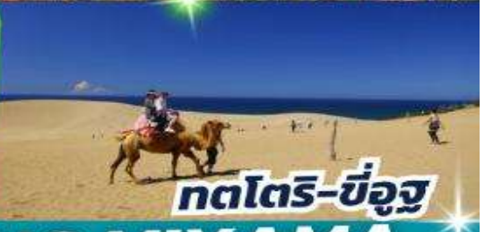
กตโตริ-ขี่อูฐ