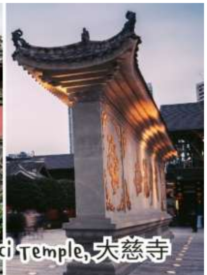
Daci Temple, 大慈寺