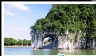
ทางวงช้าง