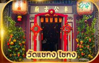
วัดแขก ไชกง