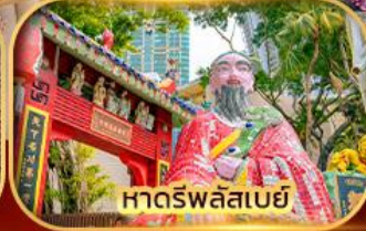
หาดรพลัสเบย์