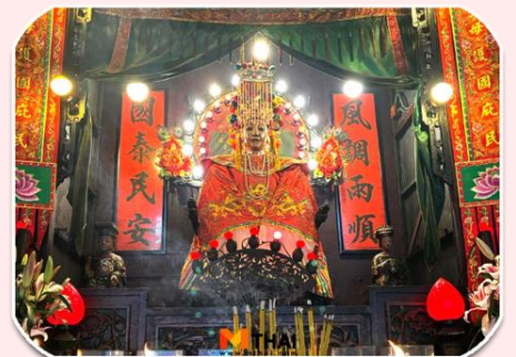
นางฟ้าพามู

จากนั้นเดินทางไปต่อที่ วัดทินหัว (วัดเจ้าแม่ทับทิม) เป็นวัดเก่าแกในฮ่องกง สมัยก่อนฮ่องกงเป็นหมู่บ้านชาวประมง ซึ่งคนจะให้ความเคารพนับถือเจ้าแม่ทับทิมทินหัวเป็นอย่างมาก เพราะเชื่อว่าเป็น เทพีแห่งท้อง