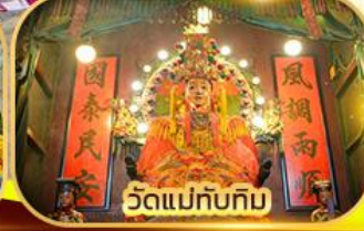
วัดแม่ทับทิม